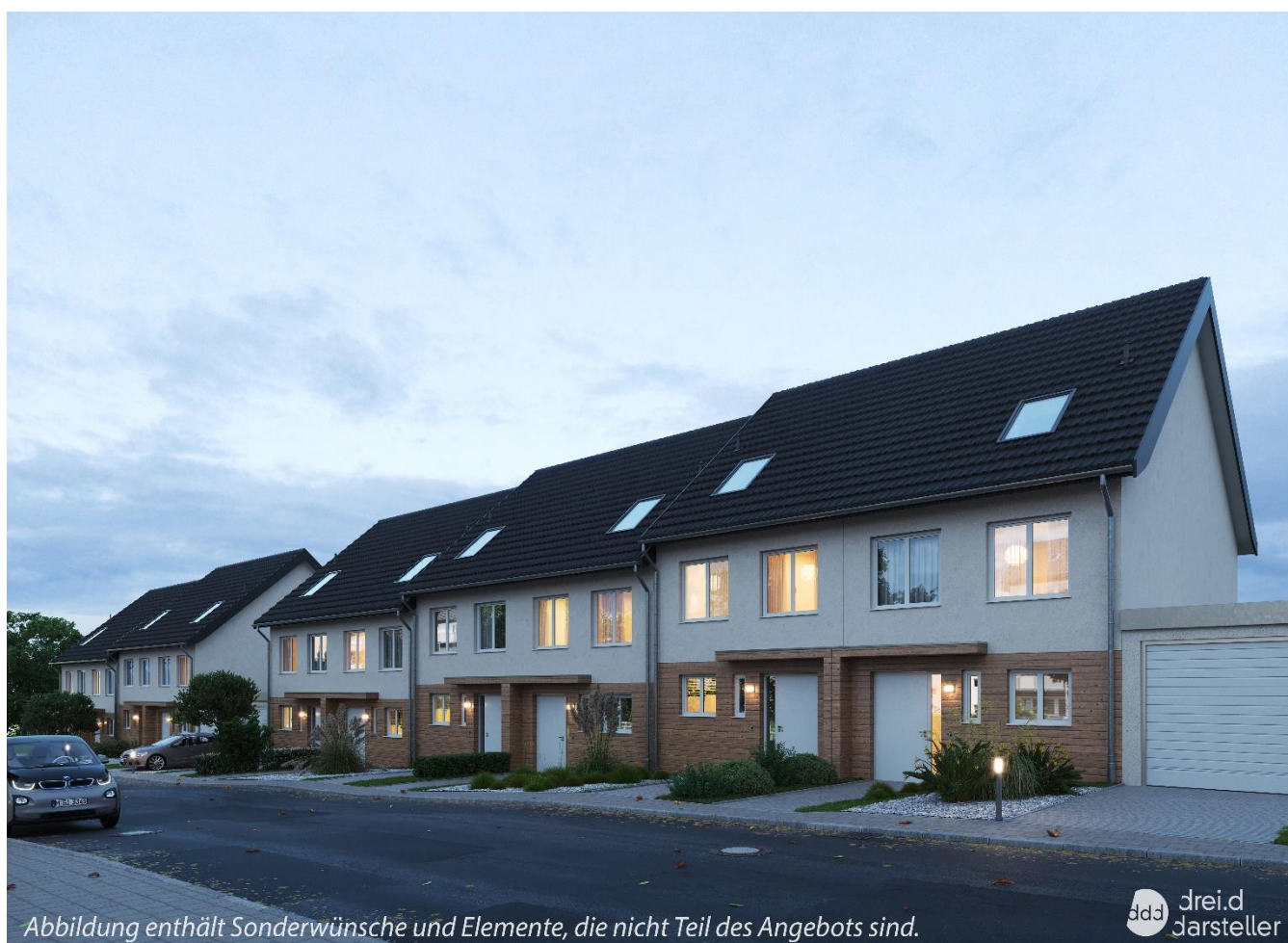
Abbildung enthält Sonderwünsche und Elemente, die nicht Teil des Angebots sind.