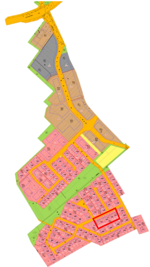
Die Lage der Grundstücke

Erste Doppelhaushälften wurden bereits erfolgreich vermarktet. Aktuell werden die ersten Reihenhäuser über einen Bauträger angeboten. Diese Baufelder befinden sich im südlichen Bereich des Buschkauer Feldes.